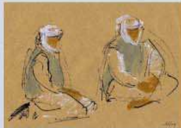
Explications sur les objectifs du DVD