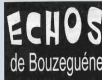
Bouzeguène au présent