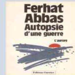
Des modèles, guides d'espérance