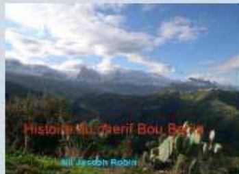
Documents sur la conquête et la présence française en Algérie