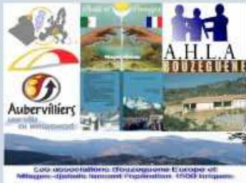
Histoire et Objectif du DVD