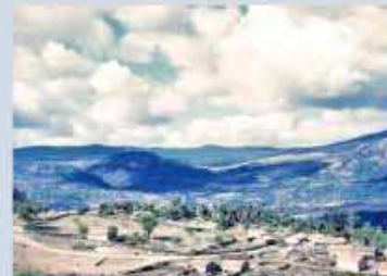
Documents sur l'histoire antérieure à la présence française