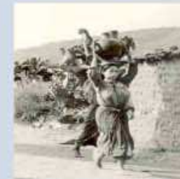
Les Idjeur, Aït Ghobri et Aït Zikki entre souvenirs et histoire