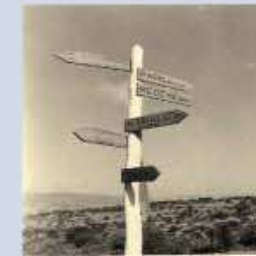
Souvenirs de mémoire croisée