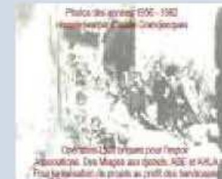
Un tour dans le passé sous forme de film