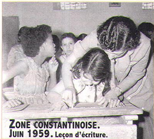
ZONE CONSTANTINOISE. JUN 1959. Leçon d'écriture.