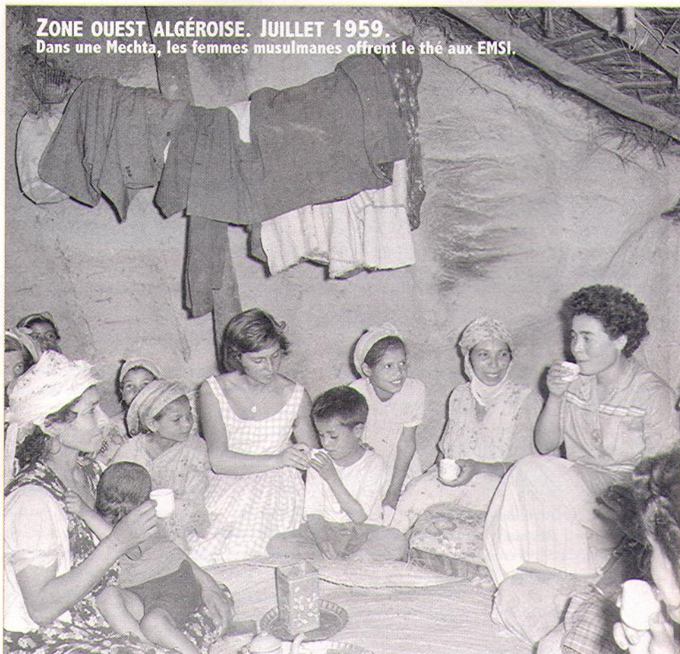
ZONE OUEST ALGÉROISE. JUILLET 1959. Dans une Mechta, les femmes musulmanes offrent le thé aux EMSI.